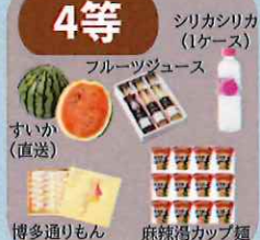
シリカシリカ (1ケース) フルーツジュース すいか (直送) 博多通りもん 麻辣湯カップ麺