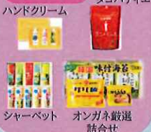
ハンドクリーム タコパティエ シャープペット オンガネ厳選詰合せ