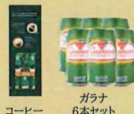
コーヒー ガラナ 6本セット