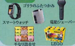
スマートウォッチ ゴリラのふたつかみ 電動シェーバー 千なり詰合せ LEGO