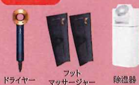
ドライヤー フット マッサージャー 除湿器