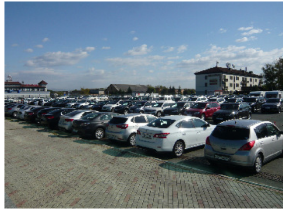
出品車両ヤードの様子