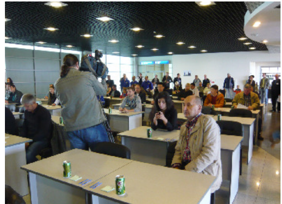
オークション会場の様子

Стартовая цена - 350 000 рублей. Торги состоятся 3 октября.