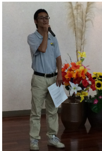
挨拶をする平河会場長