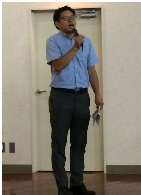
挨拶をする日向二輪事業部営業統括