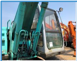
キャビンの状態(右)