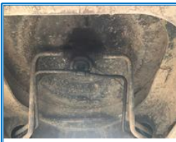
スィベルジョイント