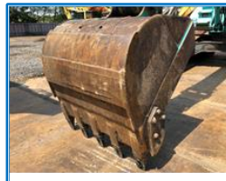
バケット底板の状態