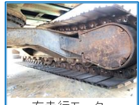
右走行モーター、 下部走行体