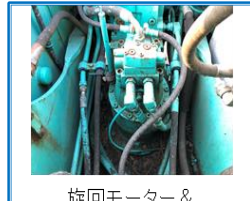
旋回モーター & 旋回マシナリー