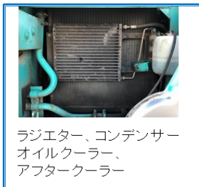
ラジエーター、コンデンサー オイルクーラー、 アフタークーラー