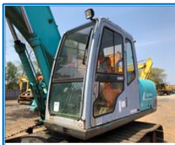
キャビンの状態(左)