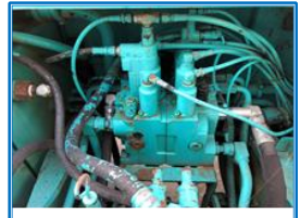
コントロールバルブ