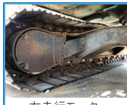
左走行モーター、 下部走行体