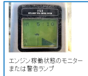
エンジン稼働状態のモニター または警告ランプ

今後、準備が整い次第、油圧ショベル以外の商材も 順次画像枚数を増やして参ります。