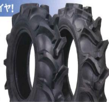
前輪用タイヤ 後輪用タイヤ